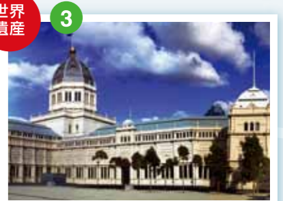
ロイヤル・エキシビション・ビルディング 1880年に万博覧会のために建設された。19世紀に世界各地で開催された万博の歴史を伝える貴重な建造物として2004年にユネスコの世界文化遺産に登録された。