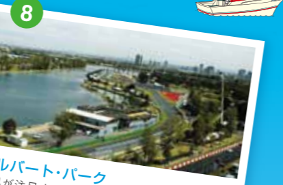
アルバート・パーク 世界が注目するF1グランプリが毎年開催される。F1開催中は公道を使用するため過酷なレースが展開される。