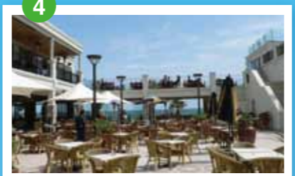
セント・キルダ メルボルン市内からすぐの人気ビーチ・エリア。ウォーキングやサイクリングを楽しむのももちろん。ショッピングエリアとしても有名。毎週日曜日にはサンデーマーケットが開かれる。

Course ■ Marathon (42.195km) ■ Half Marathon (21.1km)