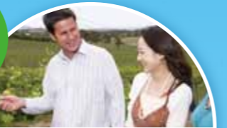
ヤラ・バレー 50以上のワイナリーが点在するオーストラリアを代表するワインカントリー。1837年に生産が始まり、名門とされるワイナリーも数多い。