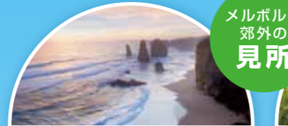
グレート・オーシャン・シャンロード オーストラリアで最も美しい海岸線として有名。中でも、海中からそびえ立つ十二使徒と呼ばれる奇岩群は自然が作り出した芸術は迫力満点。