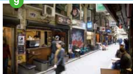
レーン・ウェイ (シティーのおしゃれな路地) カフェやレストラン、ショップが並び、メルボルンで最も活気があり、おしゃれなスポットとなっている。19世紀中～後期に作られたオーストラリアのカフェ文化が発祥した石畳の小径や19世紀建設のアーケードなど街探案におすすめ