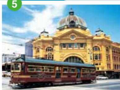
フリンドラス・ストリート駅 1日25万人が利用するターミナル駅。1854年に国内初の駅として完成したエドワード王朝風の建築はメルボルンのシンボルとなっている