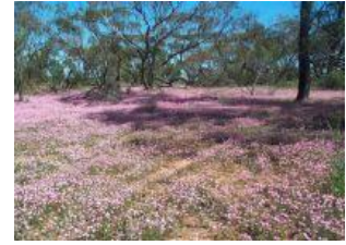
エバーラスティング