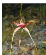
スパイダー・ オーキッド