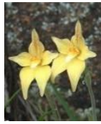
カウスリップ・ オーキッド