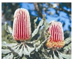
ファイアーウッド バンクシア

サザンクロス（南十字星:写真右上）という名のついたワイルドフラワーが見られるエリア。特にこの期間、7種類のサザンクロスを展示。この花を見るためにわざわざ訪れる人も。昼は野外のコンサートやガイドウォーク、夜は星空の観覧会など様々なイベントが予定されている。