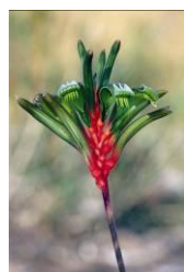
レッドアンドグリーン カンガルーポー